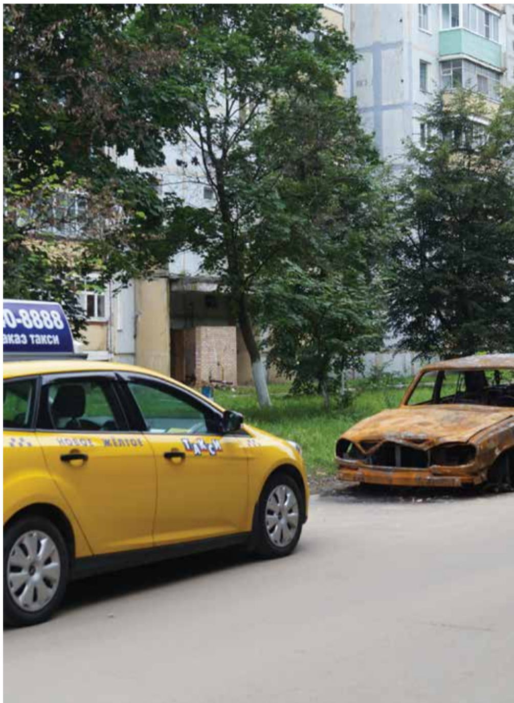
Фото: На улице Дементьева, лето 2013 года.