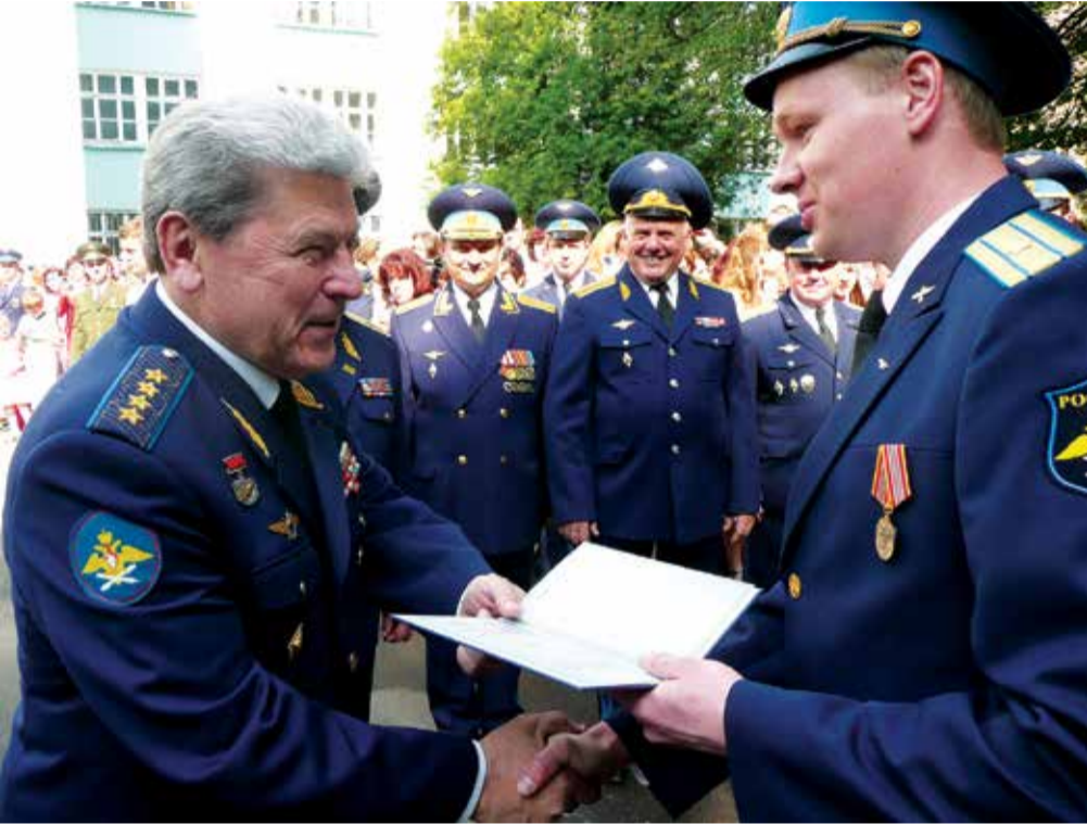
На фото: Главком ВВС П.С. Дейнекин вручает диплом майору Д.Е. Перминову.