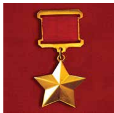
СИДОРЕНКОВ ВАСИЛИЙ КУЗЬМИЧ

Вся деятельность научных сотрудников музея направлена на сохранение памяти.