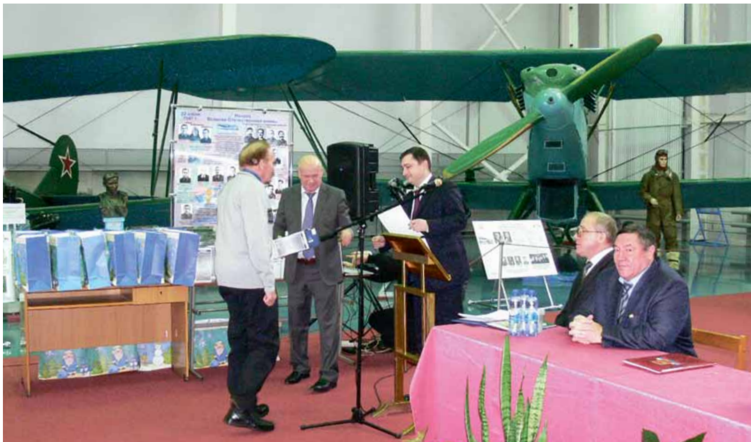
На снимке: церемония награждения работников музея